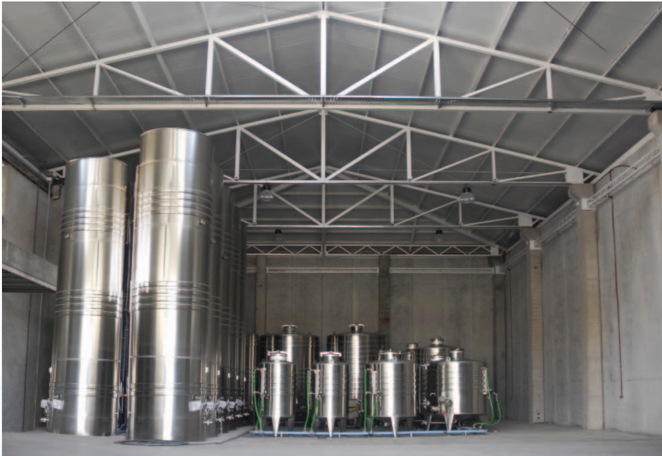
Cumple con la norma: NOM-008-200-1994.