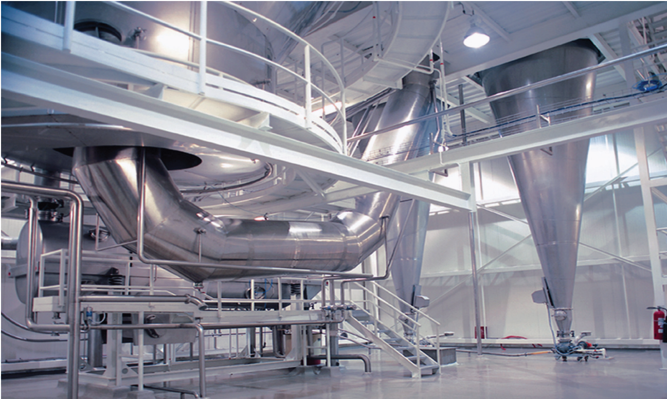
Cumple con la norma: NOM-008-ZOO-1994